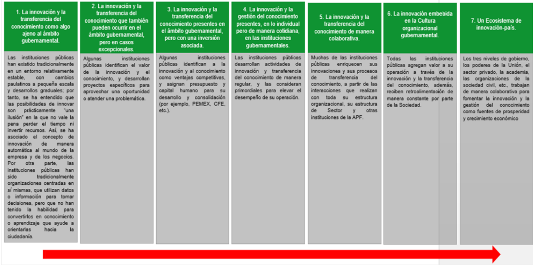
Cuadro 1. Una visión del trayecto en la innovación pública