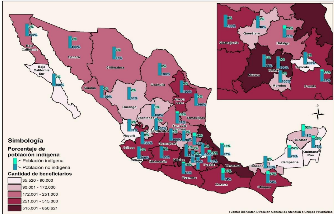
Programa Pensión para el Bienestar de las Personas Adultas Mayores Cantidad de beneficiarios por entidad federativa y población indígena, corte al tercer trimestre 2019