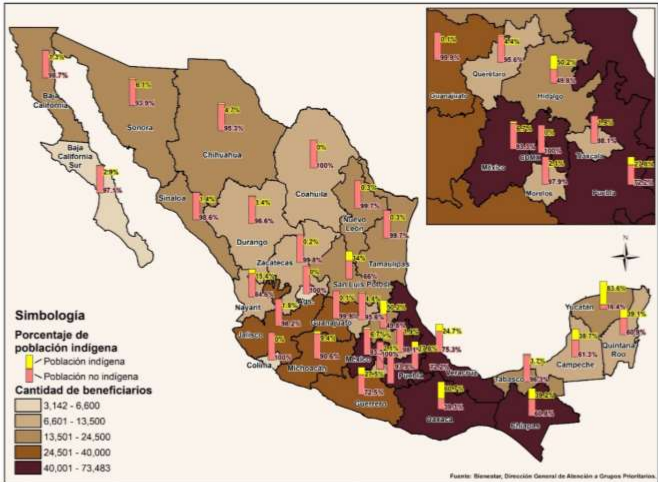
Programa Pensión para el Bienestar de las Personas con Discapacidad Permanente Cantidad de beneficiarios por entidad federativa y población indígena, corte al primer trimestre 2020